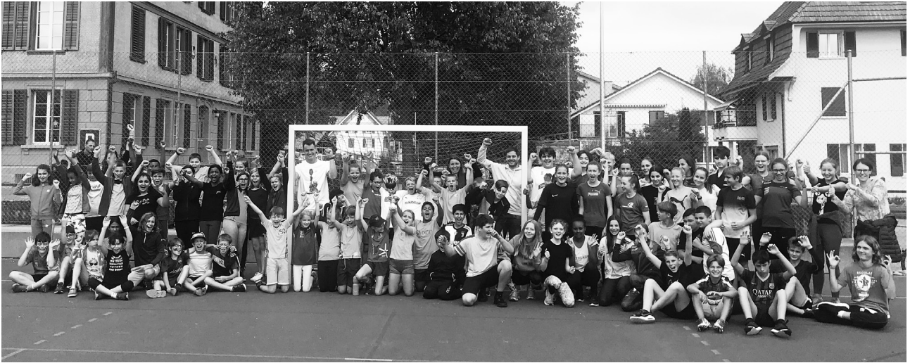
Die Klassen auf dem Podest: 1. Platz: 4d; 2. Platz: 5/6a, 7/8b und 7/8c