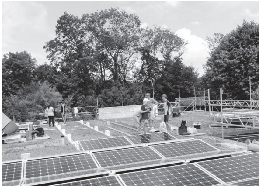
Schülerinnen und Schüler beim Montieren der Panels.

Der Grossaufmarsch belohnte unser Ausharren im regnerischen Wetter. Stolz konnten die Schüler und Schülerinnen den Besuchenden das Solarpotential ihres Daches präsentieren.