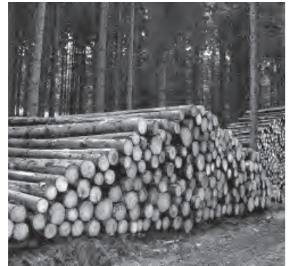
Holz Trub: Projektbeitrag à fonds perdu, Bereich Industrie & Cleantech

Eine Übersicht aller unterstützten Projekte sowie weitere Informationen finden Sie unter www.region-emental.ch , Bereich Regionale Entwicklung NRP.