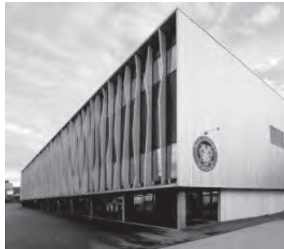
Ilfishalle Langnau i.E.: zinsloses Darlehen, Bereich innovative regionale Angebote

Nachstehend einige Beispiele geförderter Projekte im Emmental seit 2008: